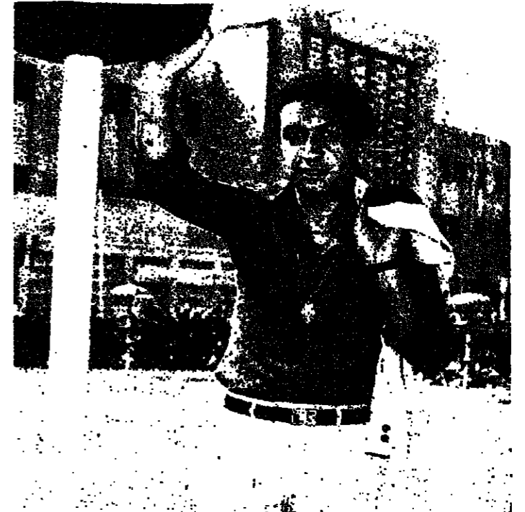
نور الشريف : البطل الاول

وفي السينما المصرية المعاصرة يتوارثنا تيار نجم ما هو الآخر وارسى قواعد بلفه الخصومية لبطال المعاصر في السينما المصرية ... كان هذا النجم هو الفنان حسين صديقي ... الممثل والمخرج الذي تبنى خطاً فكرياً مبنياً على مبادئ علم «التزيمية» اشهر اعمال الواقعية المصرية واستطاع تطوير ذلك الخط في منحنى مساعد الى ان وصل به لرحلة بناء الانسان المصري والعربي مع التركيز على انجازاته وواقعه الجديد قبل ايجابياته وسلبياته ، قسم حسين صديقي «المصري اذني» عن اشكال اليومية لرجل الشارع المصري ومخاناته من اجل مجارة الواقع الذي يزداد قسوة واضطراب دائماً ويحتاج الى ارادة تفرق هذا الحصار الواقعي وتعمل على ترويضه ايضا يقدم حسين صديقي مع التجربة الشهيرة لتيار السينما اذناك ليلي مراد . يقدم «ادم وحواء» عن مشاكل الزواج والارتباطات الاجتماعية التامة بل التفكير